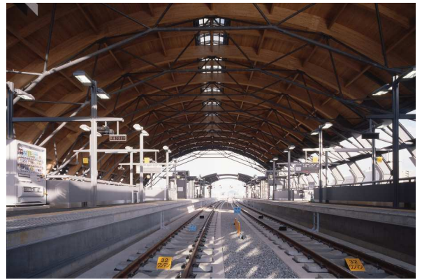
JR 高知駅 撮影：内藤廣建築設計事務所