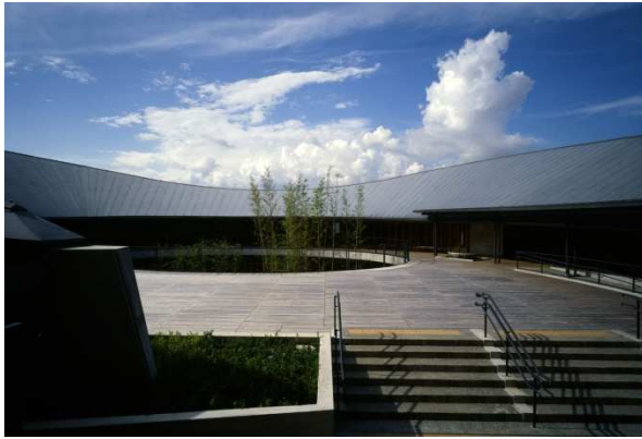
牧野富太郎記念館 撮影：内藤廣建築設計事務所