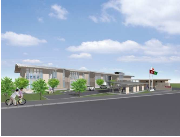
高知県立林業大学校